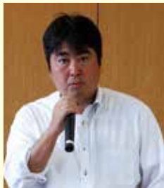
講師の水戸税務署 田邊 賢志 上席国税調査官

5月25日(月)に茨城県市町村会館において法人税・消費税の申告説明会を水戸税務署との共催で開催し21名が参加しました。講師には水戸税務署の田邊上席国税調査官にお願いし、決算事業所を対象に、申告にあたっての留意点について解説いただきました。説明会の後半では、同署の釣谷統括国税徴収官