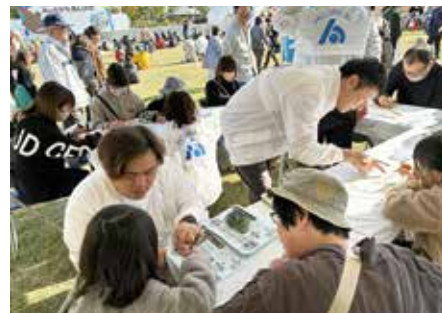
大洗秋まつり商工感謝祭