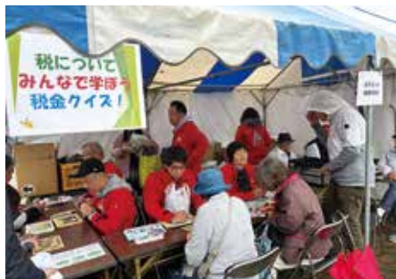
しろさと町民まつり