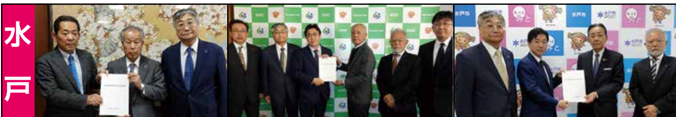
茨城町 (11月1日) 左から関根地区会会長、小林町長、君島副会長 城里町 (11月4日) 左から富永地区会副会長、君島副会長、上遠野町長、三橋地区会会長、衣笠税制委員長、仲田地区会副会長 水戸市 (11月17日) 左から君島副会長、高橋市長、寺門会長、衣笠税制委員長