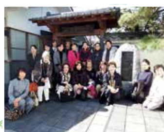
10月27日女性部会視察研修会

税務経理研究部会は10月29日(土)9名の参加により、高尾山方面を視察しました。車内において税務研修として「経理のデジタル化はじめませんか、電子帳簿保存・スキャナ保存」のDVD上映(DVD:水戸税務署提供)、『令和4年度税制改正のあらまし』を配布し研修を実施いたしました。