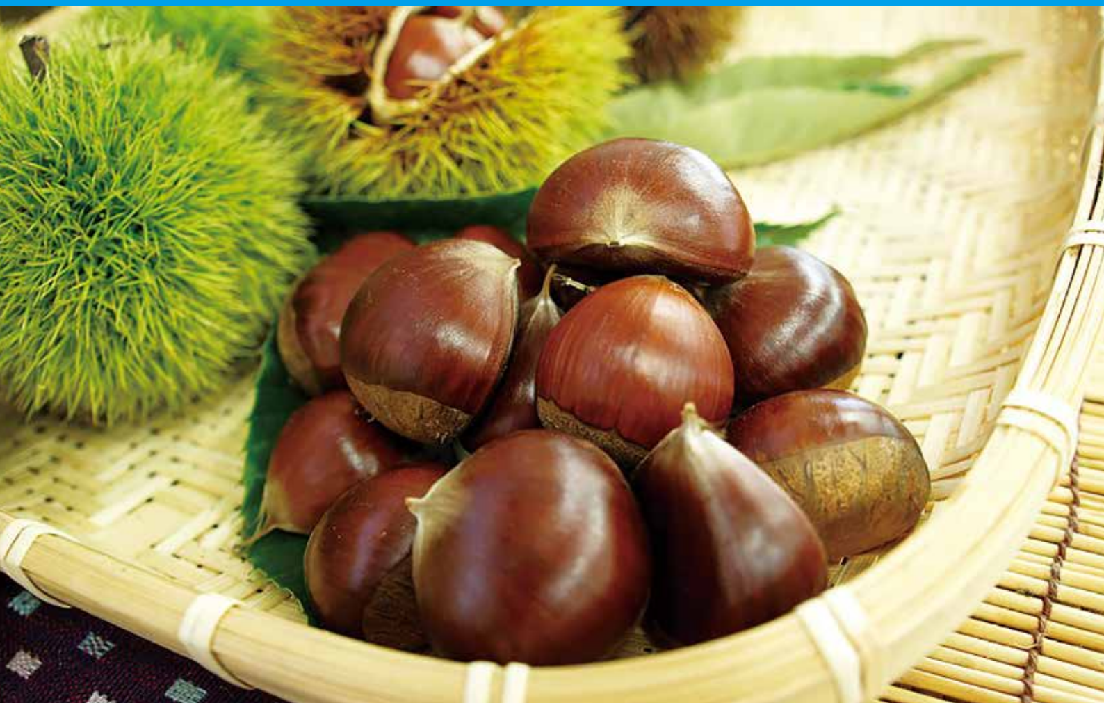
笠間の栗