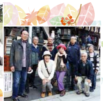
10月29日税経部会視察研修会