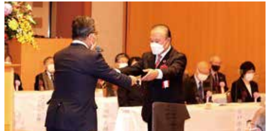
納税表彰式の様子

納税表彰は、国税の申告と納税及び租税教育等に関して、功績顕著な団体又は個人及び法人を顕彰することにより、広く納税道義の高揚等に資することを目的としています。