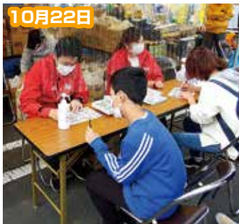
ふるさとまつりinかさま

また祭りシーズンが「税を考える週間（11月11日から11月17日）」の時期に近かったため、水戸税務署が作成した税を考える週間の「のぼり」を法人会ブースに設置し税を考える週間のPRも合わせて行いました。